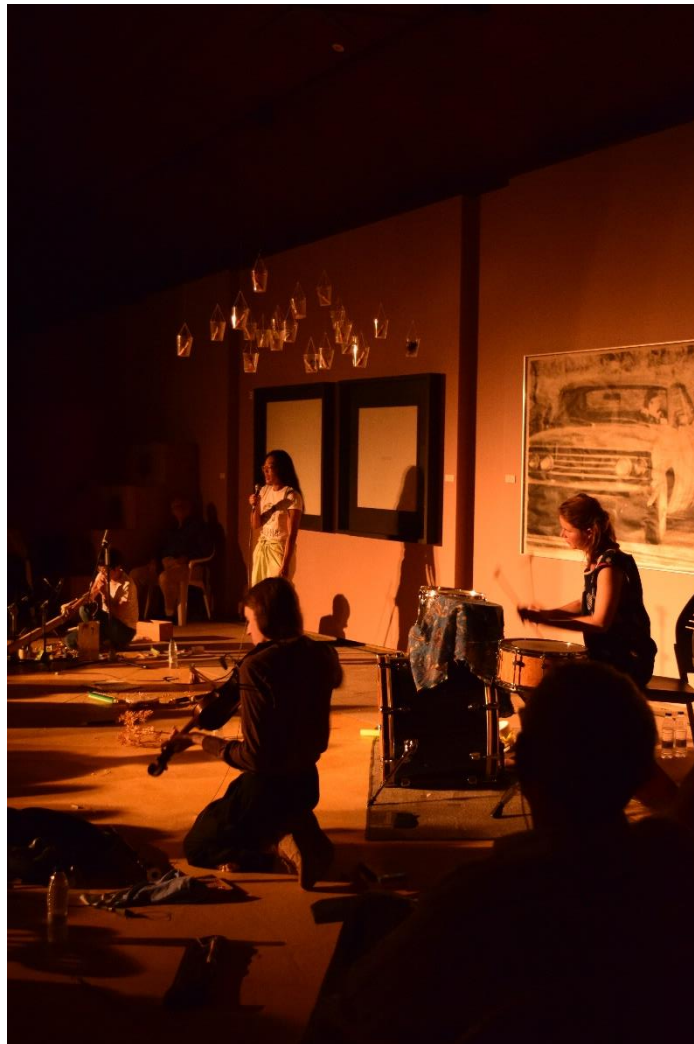
Concierto de O YAMA O en la Sala Fluxus.

Esta edición fue una coproducción del Centro Nacional de Difusión Musical (dependiente del Instituto Nacional de las Artes Escénicas y de la Música del Ministerio de Cultura y Deporte), el Consorcio Museo Vostell Malpartida, la Consejería de Cultura, Turismo y Deportes de la Junta de Extremadura, el Ayuntamiento de Malpartida de Cáceres y la Diputación de Cáceres; y contó con la colaboración del Instituto Camões, el Grupo de Música Contemporânea de Lisboa, la Asociación de Amigos del Museo Vostell Malpartida, el Gabinete de Iniciativas Transfronterizas y el Restaurante del Museo Vostell Malpartida.