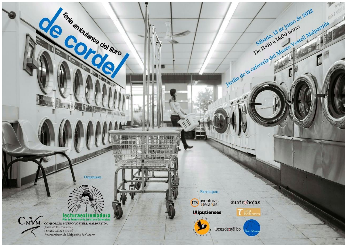
Cartel de la feria ambulante “De Cordel”.

El 18 de junio los espacios del Museo Vostell Malpartida acogieron una de las jornadas de la feria ambulante del libro, “De cordel”, promovidas por el Plan de Fomento de la Lectura de Extremadura. Participaron las editoriales Cuatro hojas, Stela literaria, Tau editores, Luces de gálibo, Papel continuo, Aventuras literarias y Liliputienses.