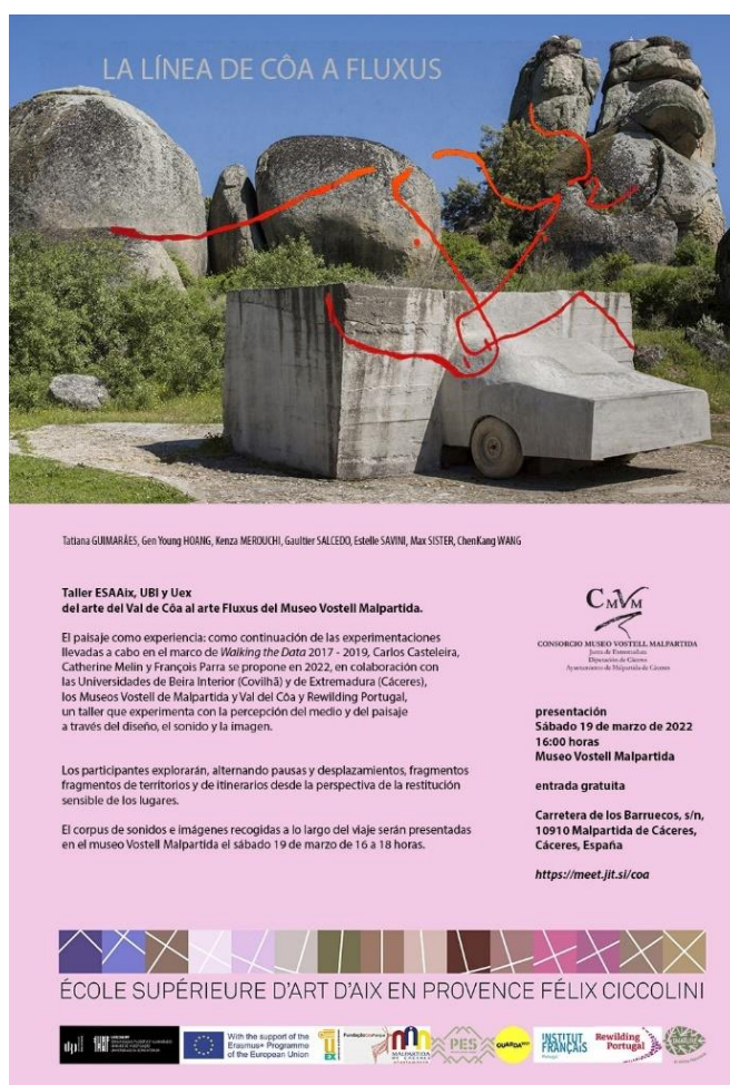
Cartel del Taller “La línea del Côa a Fluxus”.

En la jornada de clausura se mostró el trabajo desarrollado en el taller, orientado hacia la percepción del medio y del paisaje. Los participantes explicaron públicamente sus vivencias y comentaron las grabaciones de campo e imágenes fotográficas recogidas a lo largo del camino.