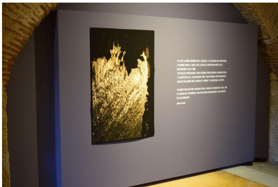
Vista de la exposición “Lourdes Germain. Ocultos. Control de fronteras, control de privilegios”

“Ocultos. Control de fronteras, control de privilegios” fue uno de los proyectos beneficiarios de las Ayudas a Artistas Visuales de la Junta de Extremadura en 2020.