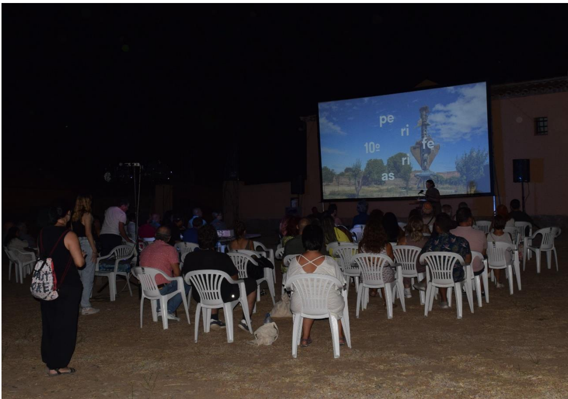
Clausura del Festival Internacional de cine "Periferias".

El 20 de agosto se celebró en el Museo Vostell Malpartida la jornada de clausura de la décima edición de Festival Internacional de cine "Periferias" de Marvão (Portugal) y Valencia de Alcántara (España). Se proyectó el largometraje documental "El Leopardo de las Nieves", ópera prima de Marie Amiguet y Vincent Munier. En esta gala de clausura también se dio a conocer y se entregó el premio "Tajo-Tejo Internacional" a la película más votada por el público.