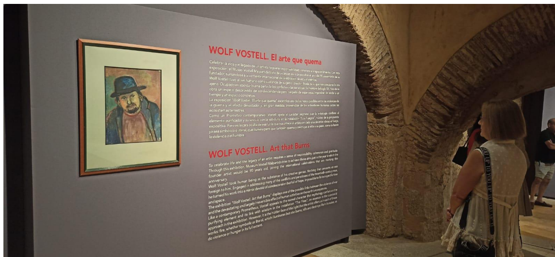
Día de la inauguración de la exposición “Wolf Vostell. El arte que quema”.

Esta muestra fue fruto de la colaboración entre la Consejería de Cultura, Turismo y Deportes de la Junta de Extremadura, el Consorcio Museo Vostell Malpartida y The Wolf Vostell Estate y contó con la contribución desinteresada de la Denominación de Origen Protegida “Pimentón de la Vera”.