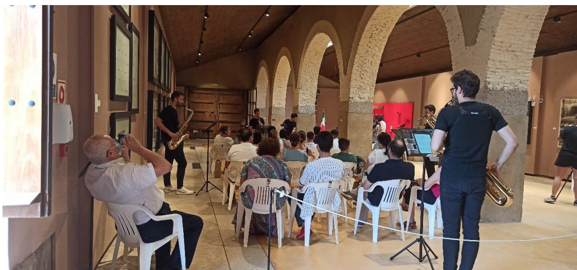
Concierto de Klexoslab en la Sala Fluxus.

El Museo Vostell Malpartida acogió el 2 de julio el concierto de presentación de las composiciones creadas en la quinta edición del curso internacional de saxofón y composición organizado por KlexosLab en Plasencia. Se trata de un curso dirigido a saxofonistas y compositores cuyas otras sesiones se celebraron en la capital placentina entre el 28 de junio y el 1 de julio.