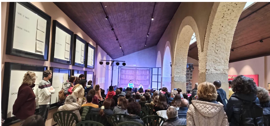
Aforo completo en el espectáculo de pompas de jabón y clown "Burbujas con arte", por 7 Bubbles.

Esta loca comedia de arte efímero dio protagonismo al público familiar, que compartió conocimientos y experiencias. El espectáculo intergeneracional "Burbujas con arte" recurrió a la creación de nuevas imágenes y texturas en el juego dramático.