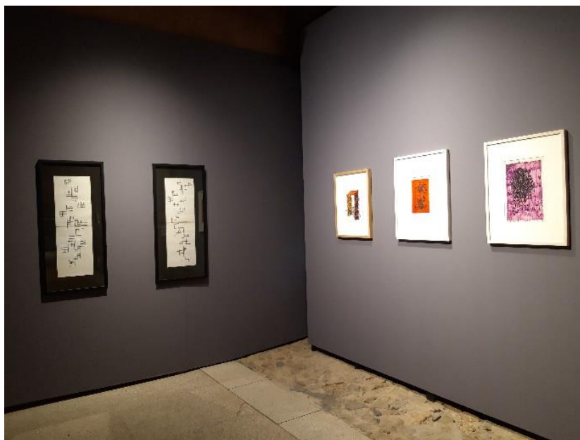
Vista de la exposición “Ana Hatherly. Dibujar es hablar con el silencio” en el Museo Vostell Malpartida.

Ana Hatherly es una de las creadoras portuguesas de mayor reconocimiento, con una contribución muy activa e influyente en la academia, la poesía, las artes visuales, el cine o la filosofía.