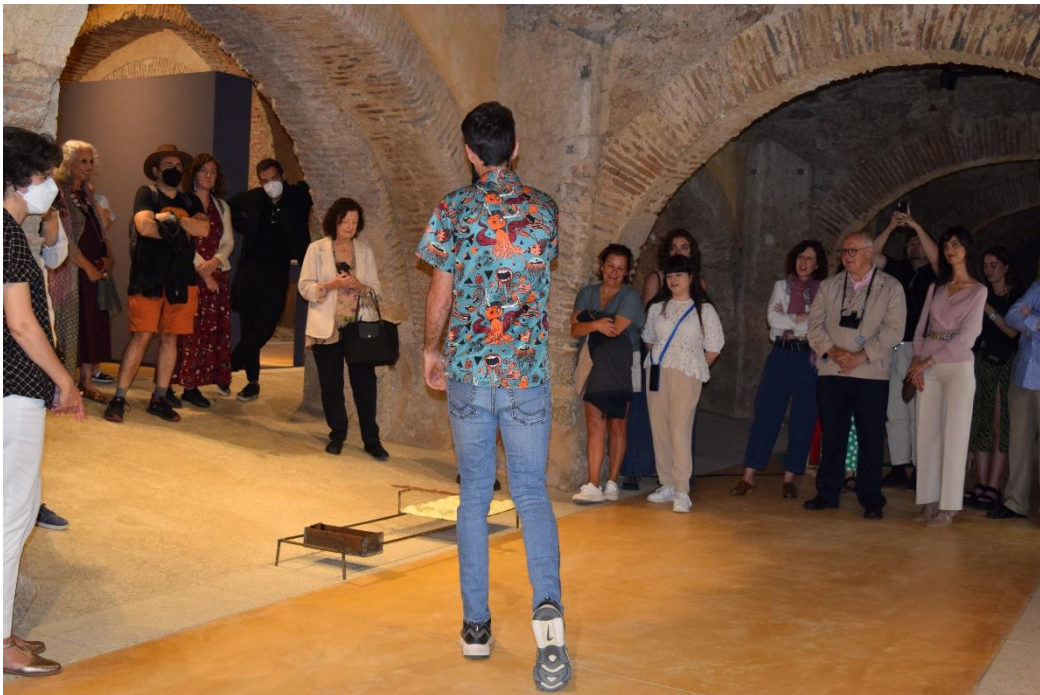
Día de la inauguración de la exposición de las obras realizadas en el taller "Gestionar ideas. De lo analógico a lo digital"